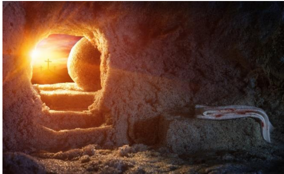
Source : The Power of His Resurrection - Focus on the Family

Il y a un grand besoin d'intentions de messes.