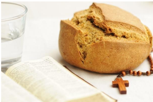
Source : Carême : Temps de Revenir à la Source - Paroisses de Calais

RÉUNION CAT et CPP : 23 avril à 19 h à la sacristie.